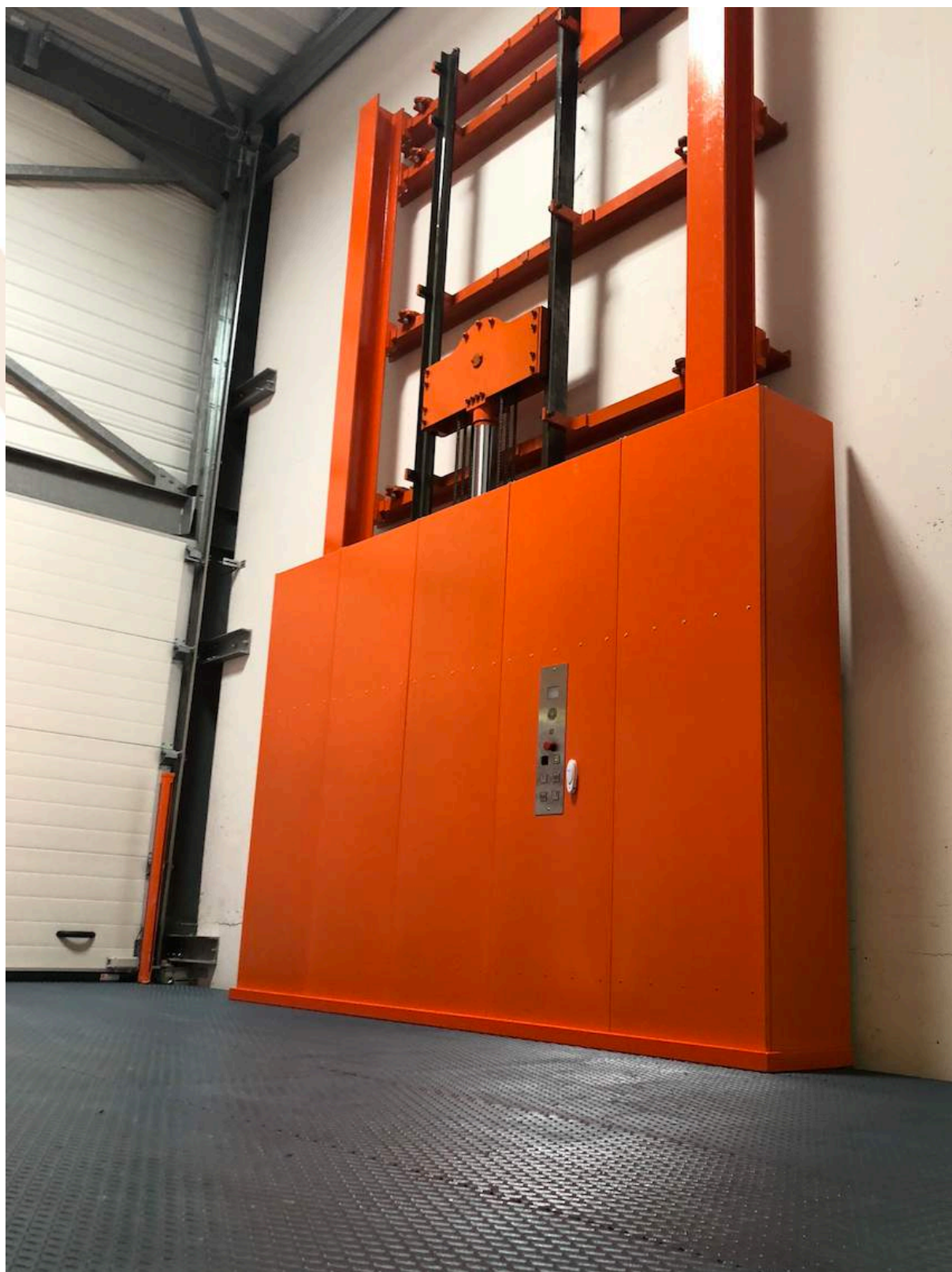
(Transport Laure 44 Nantes)